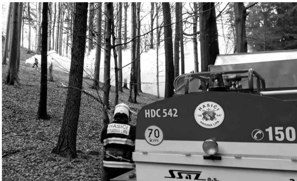
Fotografie z cvičení na Vlčí hoře, kterého se 25. 11. 2018 kromě našich hasičů zúčastnily i jednotky z Rybníště a Brtníků. Jejich úkolem bylo zajistit dálkovou dopravu vody z rybníka až k fiktivnímu požáru v blízkosti rozhledny.