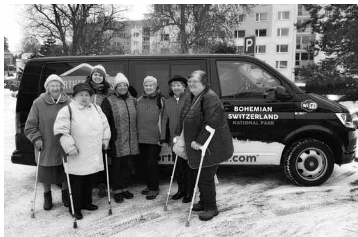
O dva týdny později 24. ledna uspořádala tatáž společnost další výlet pro aktivní seniory. Opět se jelo na Bastei, tentokrát ale v jiném složení. Děkujeme.