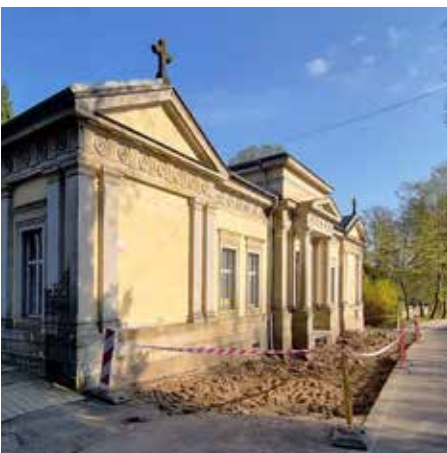
Fotografie z průběhu prací na začátku května

Poté, co jsme v minulých dvou letech vybudovali chodník od dětského domova kolem památníku k hřbitovu, upravujeme i prostor přímo před hřbitovní kaplí. Po odstranění pařezů a opravě odvodnění bude prostor nově vydlážděn žulovými kostkami a doplněn novým mobiliářem. Práce provádí technické služby města. Následovat bude oprava fasády.