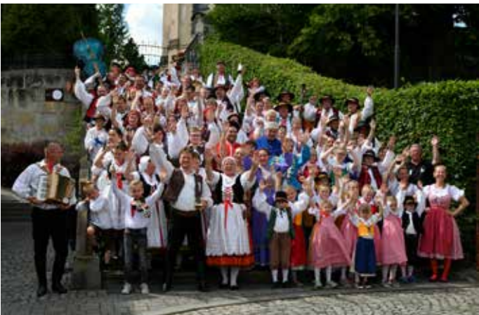
Společná fotografie účastníků folklorního festivalu