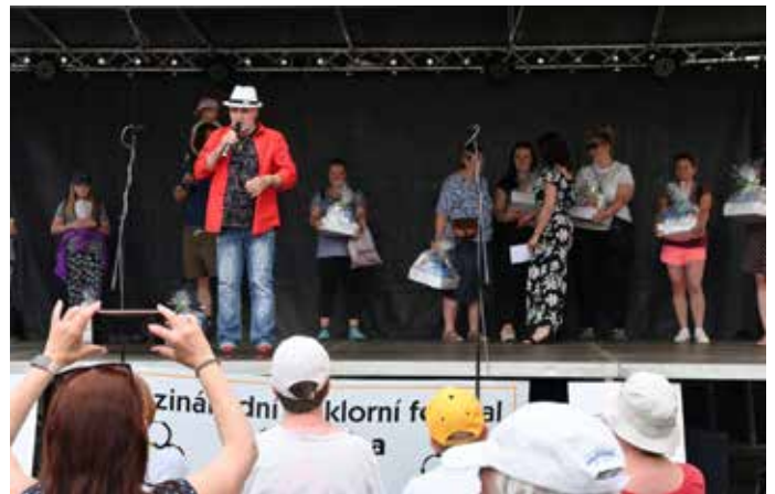
Z vyhlášení soutěže o nejlepší bábovku jarmarku