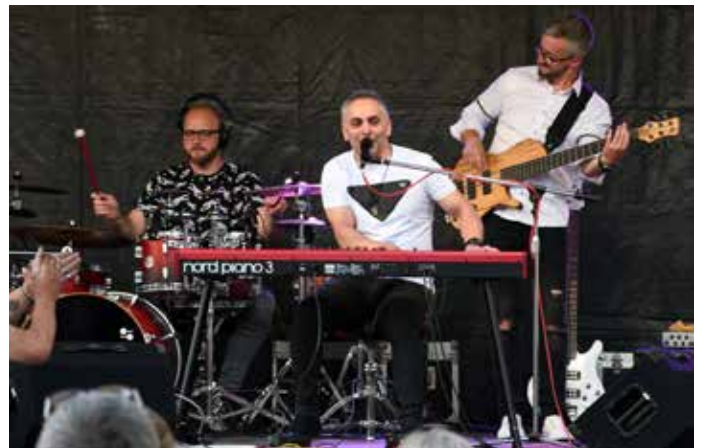
Koncert Vlasty Horváta