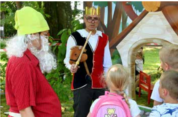
Momentka z Pohádkového lesa