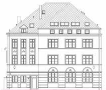
Připravujeme rekonstrukci bytového domu Masarykova 2