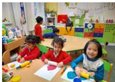
Včelka je tu denně pro předškoláky