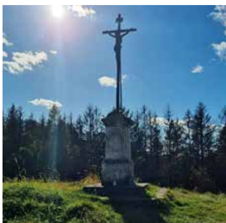
Získali jsem dotaci na opravu dalších dvou křížků – v Dlouhém Dole a na Kaprštálu