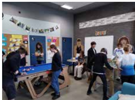
T-klub otevřel dveře dětem z místní ZŠ