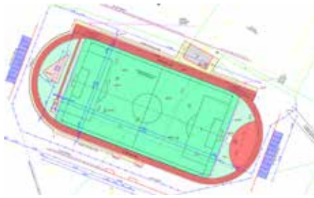
Připravujeme vybudování atletického areálu