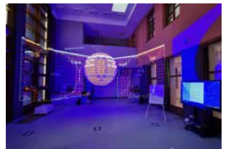
Dokončili jsme přístavbu multimediální učebny v základní škole