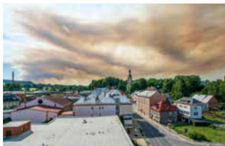
Požár v Českém Švýcarsku vyděsil nejen občany Krásné Lípy