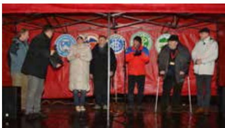
XVII. Mezinárodní zimní sraz turistů