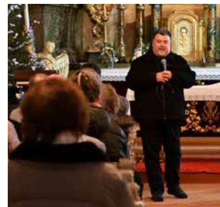
1. adventní koncert byl věnován 100. výročí od narození Ilji Hurníka