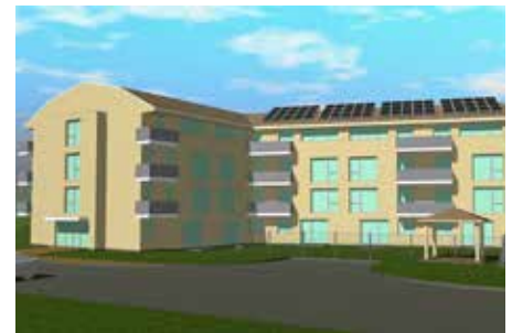
Chystáme výstavbu třetího domu pro seniory