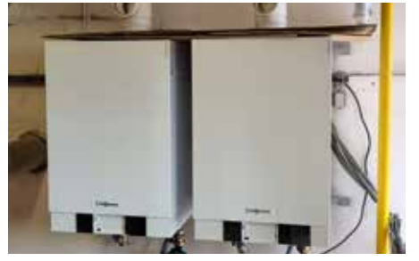
Základní školu jsme vybavili moderními kondenzačními kotly