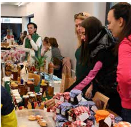
Vánoční trhy se první adventní nedělí těšili velké účasti