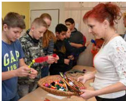
Den otevřených dveří v Kostce