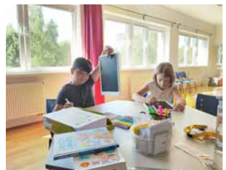
Letní škola v T-klubu