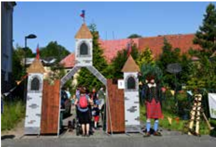
Pohádkový les měl v letošním roce rekordní účast