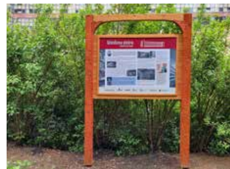
Doplňujeme informační panely k historii města