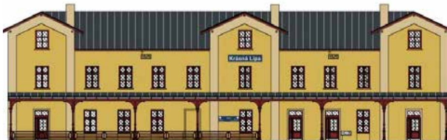
Předáním staveniště realizační firmě byla zahájena rekonstrukce nádražní budovy