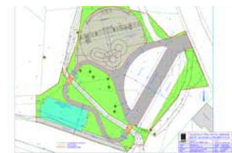
Zahájili jsme výstavbu víceúčelového prostoru pod Cimrákem