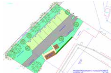
Připravujeme realizaci karavanových stání