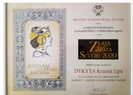
FS Dykta obdržel významné ocenění Zlatá múza Severu 2020