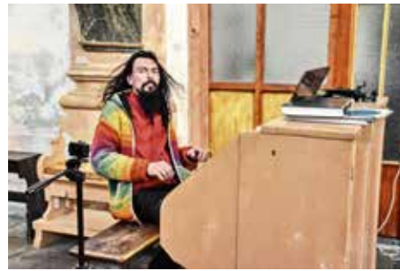
V kostele sv. Máří Magdalény proběhl benefiční koncert Varhana Orchestroviče Bauera pro hasiče zasahující při požáru v Českém Švýcarsku