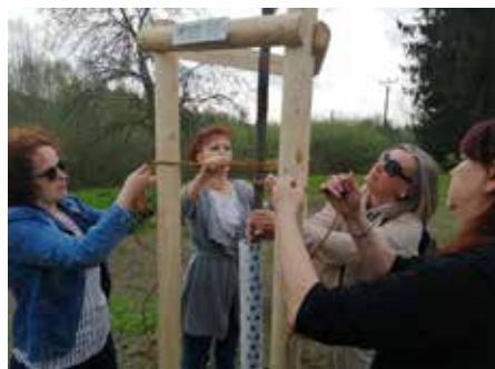
Kostka vysadila tři jabloně