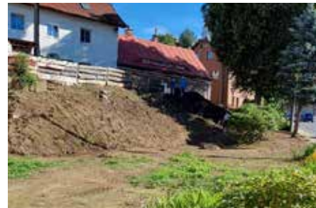
U městského bytového domu Masarykova 9 vzniká nová parková úprava