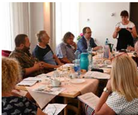
Po požáru v Českém Švýcarsku navštívila Krásnou Lípu ministryně životního prostředí Anna Hubáčková