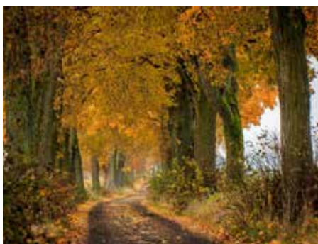
Vítězná fotografie Miroslava Kováče v soutěži Alej roku 2022 je ze Skřivánčího pole