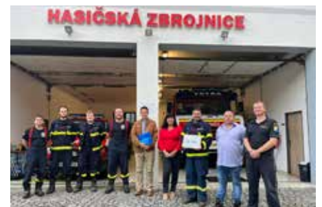
Výtěžek z benefičního koncertu pro hasiče jsme předali dobrovolným hasičům z Kytlic