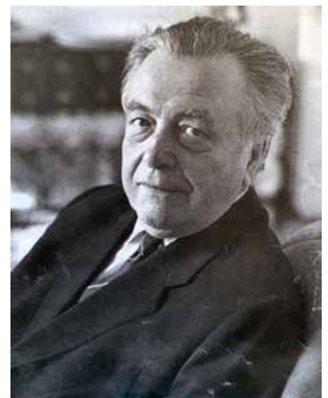
Profesor Ilja Hurník