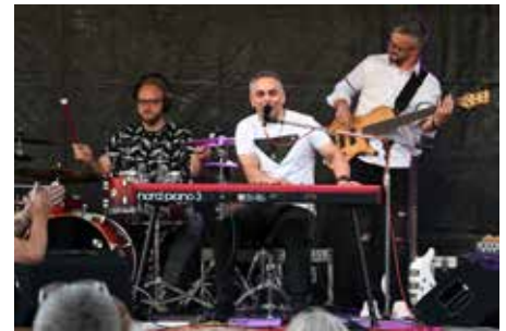
Příjemnou atmosféru navodil koncert Vlasty Horvátha