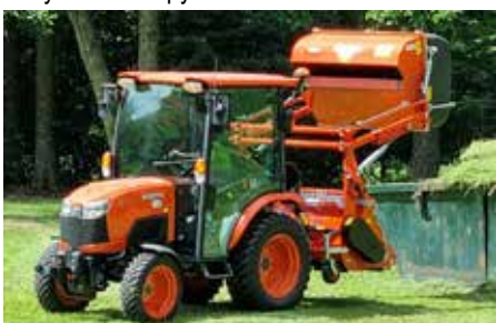
Doplnili jsme vybavení technických služeb