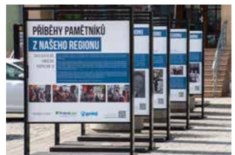
Druhá letošní venkovní výstava patřila projektu Příběhy pamětníků z našeho regionu