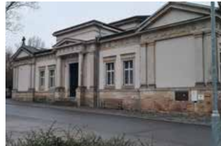
Proběhla úprava prostor před kaplí u městského hřbitova