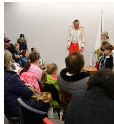
Na závěr první adventní neděle byla pro děti připravena v prostoru Aparthotelu pohádka