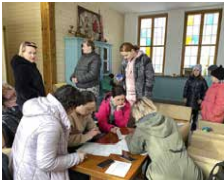
Kostka pomáhá lidem z Ukrajiny