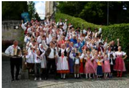
Proběhl 10. ročník Mezinárodního folklorního festivalu Krásná Lípa