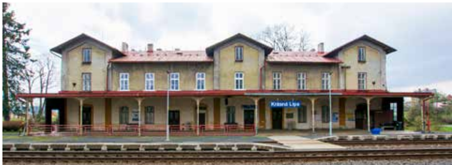
Nádražní budova v Krásné Lípě projde rozsáhlou rekonstrukcí