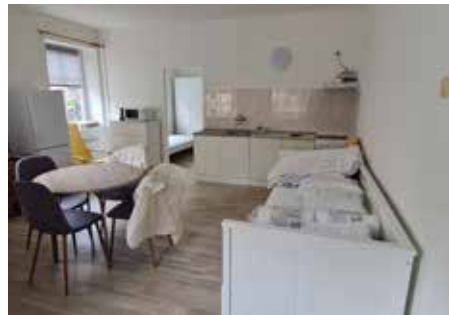
Válka na Ukrajině zasáhla všechny - poskytli jsme ubytování několika rodinám