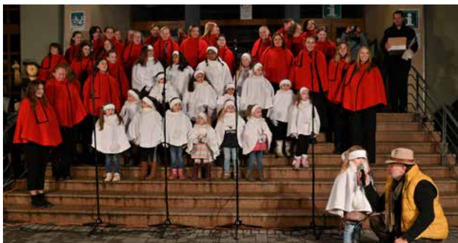
U rozsvícení vánočního stromu si společně zazpívaly děti z mateřské školy Motýlek, děti z dětského domova a dětský pěvecký sbor Severáček