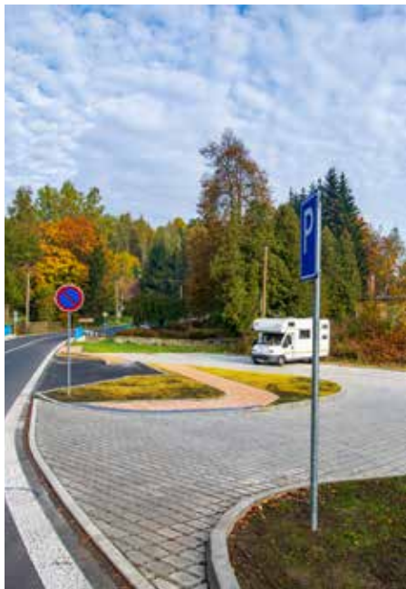
V Krásném Buku jsme dokončili první část parkoviště