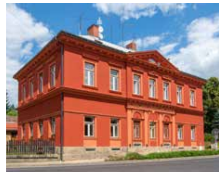
Bytový dům Masarykova 9 dostal novou fasádu