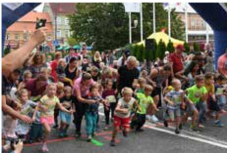
Dětské běhy v rámci Dne Českého Švýcarska lákají každým rokem více dětí