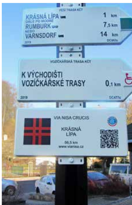
Krásnou Lípou prochází další zajímavá dálková turistická trasa VIA NISA CRUCIS