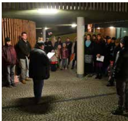
Připomněli jsme si výročí sametové revoluce u Lavičky Václava Havla