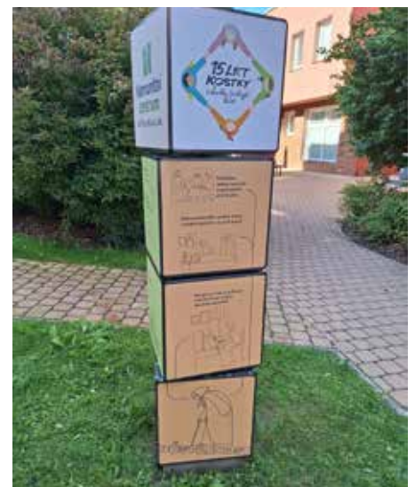
Nový interaktivní prvek ve veřejném prostoru u radnice upozorňující na aktivity p. o. Kostka Krásná Lípa