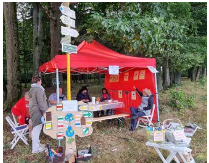
Krásnolipští turisté pomáhali 23. 9. 2023 na Dymníku při Dni za obnovu lesa, který pořádaly Lesy ČR.