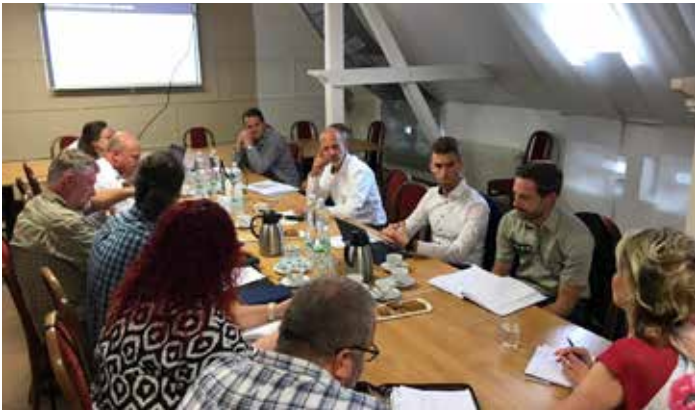
Na radnici proběhlo 13. září jednání se zástupci německých obcí a HZS ČR k mezinárodnímu projektu o požární ochraně